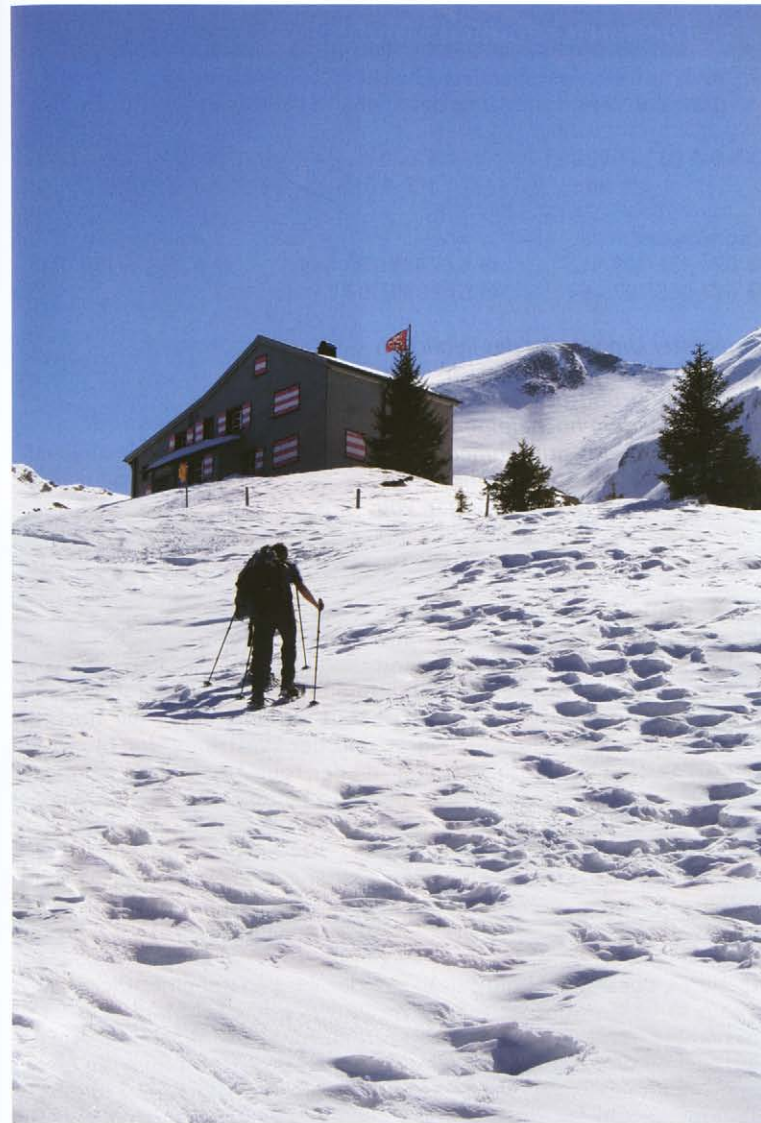
Aufstieg zum Brisenhaus.

Berggasthaus Stockhütte: 041 620 53 63, www.stockhuette.ch